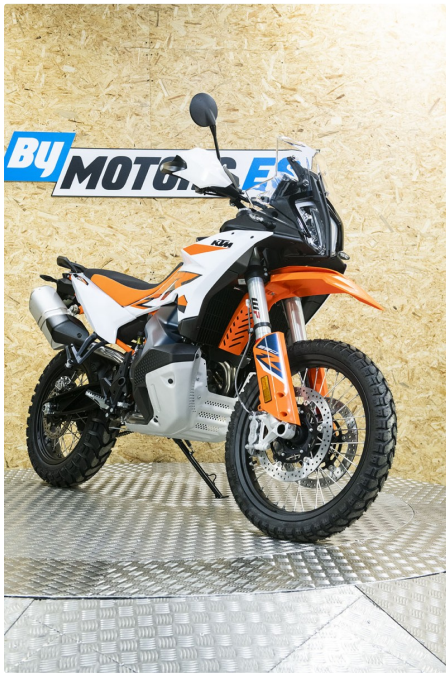
KTM Adventure 890 R