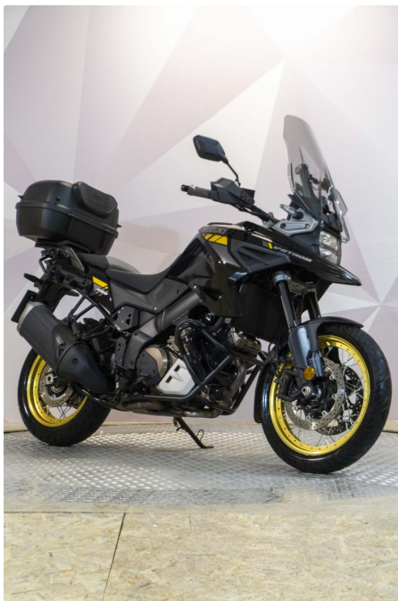
SUZUKI V-Strom 1050 XT