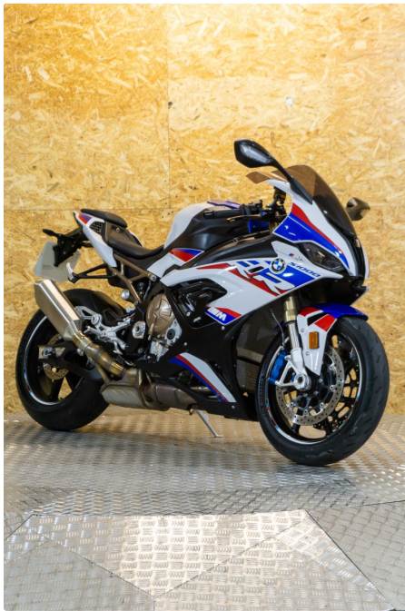
BMW S1000 RR