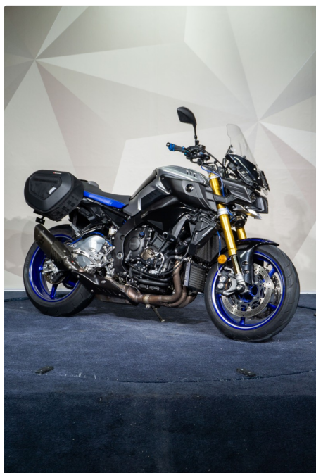
YAMAHA MT-10 SP

**Escape Akrapovic* Suspensión Electrónica Ohlins* Amortiguador Dirección Electrónico Ohlins* Accesorios Barracuda-Rizoma- Gilles**