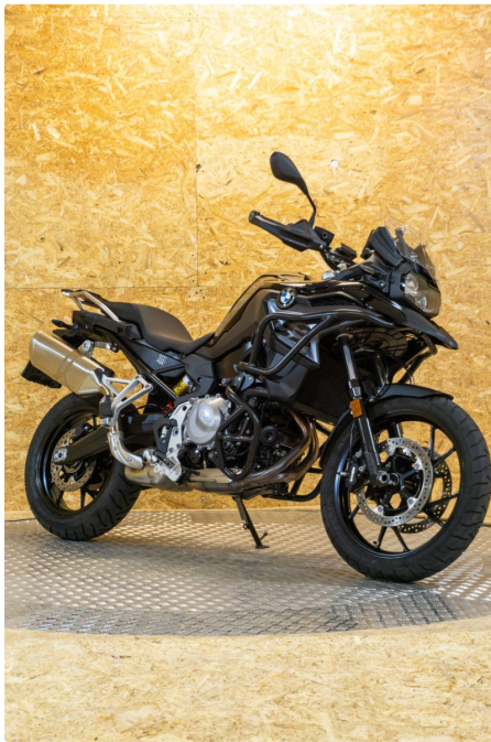
BMW F 750 GS A2

**LIMITADA A2**REESTRENO**POCOS KM**PAQUETES**