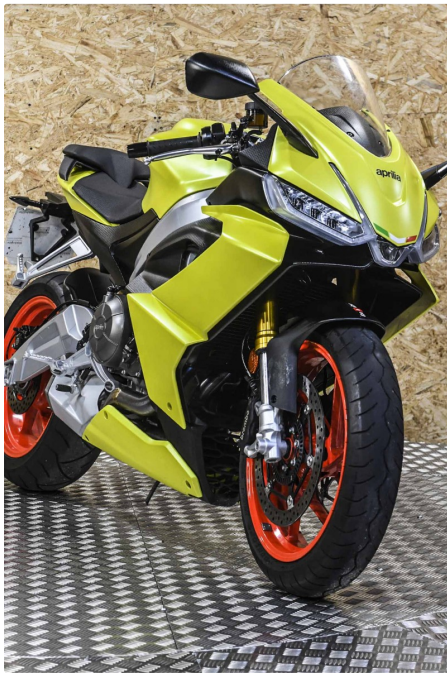
APRILIA RS 660

**SEMINUEVA** ORIGINAL **GARANTIA OFICIAL**