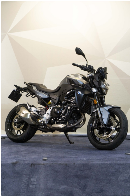
BMW F 900 R