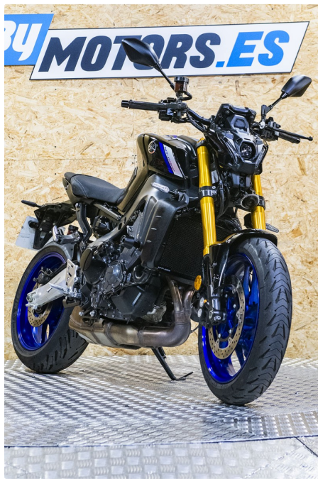
YAMAHA MT-09 SP