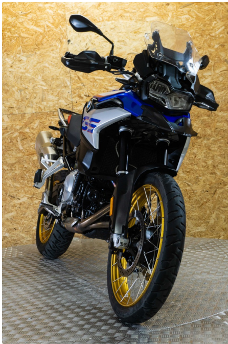
BMW F 850 GS